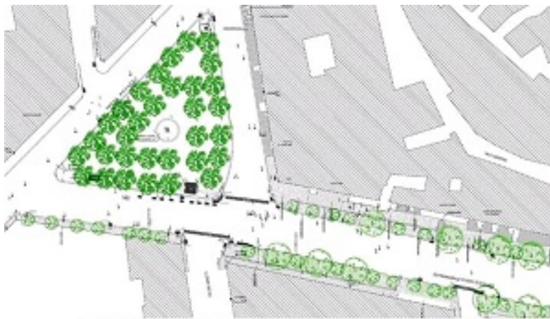
PLANIMETRIA DELLO STATO DEI LUOGHI

Scritto da Saverio F. Iacobellis Giovedì 18 Aprile 2019 19:28