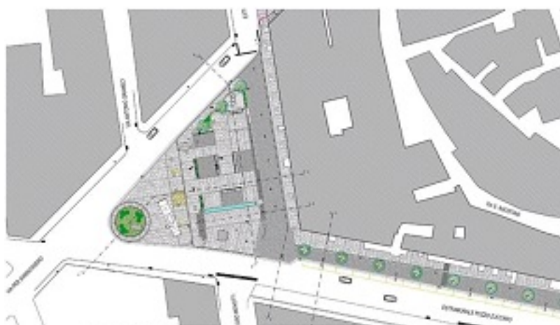
PLANIMETRIA PROGETTO IN ESECUZIONE

Il progetto di riqualificazione della Piazza Kennedy della discordia, D'Antini, prevede la creazione di uno spazio pubblico di qualità, con un'area verde centrale e un'area pedonale di collegamento con le vicine vie. Il progetto è stato approvato dal Comune di D'Antini e si sta eseguendo.